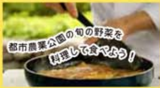
都市農業公園の旬の野菜を料理して食べよう!