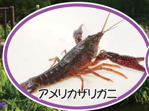
アメリカザリガニ

アメリカザリガニはフライ？ ウシガエルはから揚げ？ どんなふう食べるかは お楽しみに！