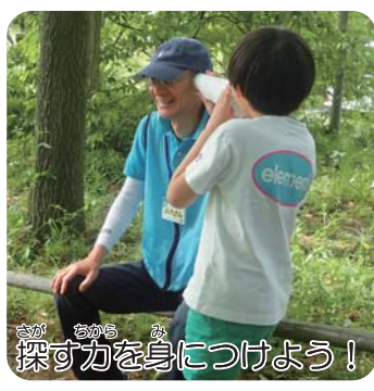
探す力を身につけよう!