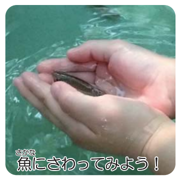
魚にさわってみよう!

事前申込の申込方法 当公園あやせ川清流館内の窓口もしくは、往復ハガキまたはFAXに参加希望者全員(保護者含む)の①住所 ②氏名(ふりがな) ③年齢(学年) ④電話・FAX番号、及び「(プログラム名)参加希望」と明記の上、お申込みください(往復ハガキは返信面に宛名を明記してください)。 ※申込内容に不備がある場合、落選の対象となる可能性がございます。