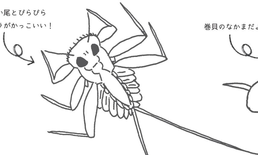
ヒラタカゲロウのなかま