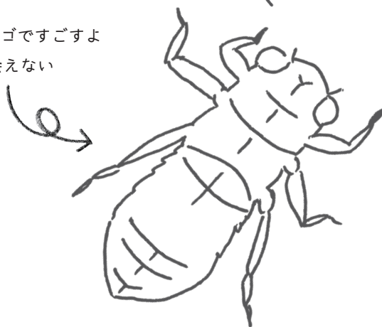
ムカシトンボのヤゴ