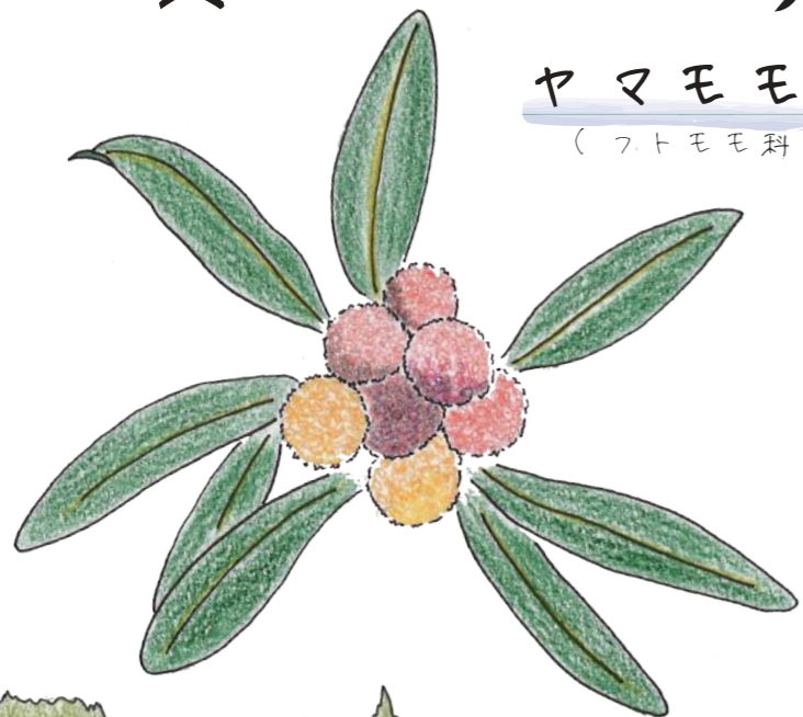
ヤマモモ (フトモモ科)