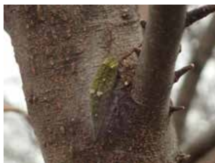
アカボシゴマダラの幼虫