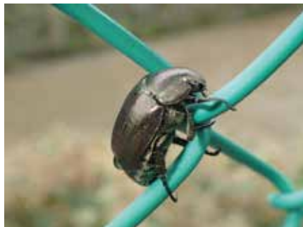
ドウガネブイブイ