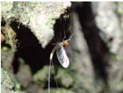
コカゲロウの一種