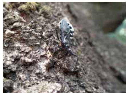
ヨコヅナサシガメ