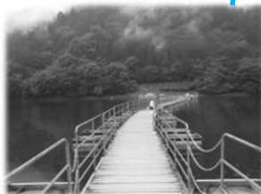
湖面の水位低下や悪天候(強風など)のため通行止になる場合があります。