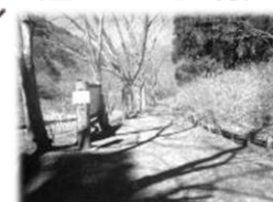
至 都民の森、檜原村、五日市方面