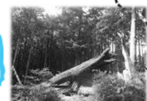
峠にあった大きなコナラの木は 数年前に倒壊