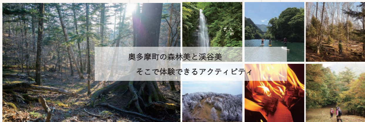
奥多摩町の森林美と渓谷美

国立公園 広さランキング ※陸域のみ 第1位 大雪山 第2位 磐梯朝日 第3位 中部山岳 第4位 上信越高原 第5位 秩父多摩甲斐