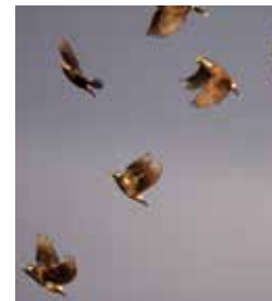
↑ムクドリは草刈り後に集団で飛来する姿がみられる。

浦安市は都心に近くほとんどが埋め立て地のため、自然が少ないと思われがちです。しかし、公園や緑道など緑地が多く、野鳥にとって重要な生息地となっています。