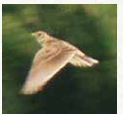
↑ヒバリは高く飛びながらさえずり回るのが特徴。

繁殖期の野鳥は、自分のなわばりを宣言するためや、メスを呼び込むために鳴きます。これらを「さえずり」といい、特にスズメ目の鳥は複雑で美しい音色の鳴き方をします。