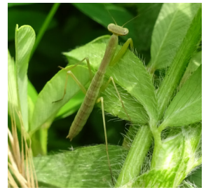
↑カマキリの幼虫。4月にはたく さん見られるが、季節が進むに 従って数は減っていく。

4月下旬には、夜になると と藪から機械音のような 「ジー」というクビキリギス が鳴き声が聞こえ、初夏の 訪れを感じます。