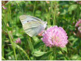
↓モンシロチョウ。3月の早い時 期から見られるチョウ

3～4月は冬から春へと目まぐるしく季節 が変わります。3月上旬の急に春めいた温か い日には、成虫で冬越しするムラサキシジミ やムラサキツバメが紫色に光る美しい翅をは ためかせ、ときどき木の葉の上で日光浴をし ます。さらに、日が進むと蛹で越冬していた シロチョウやキチョウたち羽化し、花の咲き だした原っぱを華やかにします。