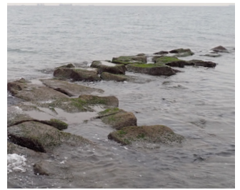
↑風と波にさらされる場所で発見

本種は国内でも10カ所程の 場所でしか見つかっていないヤ ドカリで、環境省の海洋生物レ