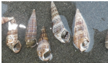
↑イボウミナを背負った本種

本種は、貝殻を拾うとほぼ中に入っているほど、たくさ ん生息しています。しかし、近年の三番瀬では貝殻の数が 減少し、本種にとって貝殻は貴重な資源となっていま