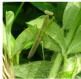
↑カマキリの幼虫。4月にはたくさん見られるが、季節が進むに従って数は減っていく。

4月下旬には、夜になると藪から機械音のような「ジー」というクビキリギスが鳴き声が聞こえ、初夏の訪れを感じます。