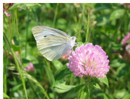
↓モンシロチョウ。3月の早い時期から見られるチョウ

3～4月は冬から春へと目まぐるしく季節が変わります。3月上旬の急に春めいた温かい日には、成虫で冬越しするムラサキシジミやムラサキツバメが紫色に光る美しい翅をはためかせ、ときどき木の葉の上で日光浴をします。さらに、日が進むと蛹で越冬していたシロチョウやキチョウたち羽化し、花の咲きだした原っぱを華やかにします。