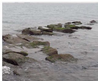
↑風と波にさらされる場所で発見

今年1月、凍えるような寒い日の海洋生物調査で新たな成果がありました。それは全国的にも珍しいヤドカリ、ヨモギホンヤドカリの発見です。