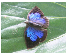
↑ムラサキシジミ。冬は成虫同士が集まり集団で越冬する。