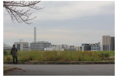
▲11月の雲に隠れた富士山

毎年11月と1月の2回、都市農業公園の荒川土手から「ダイヤモンド富士」を見ることができます！1月は、19日（木）～20日（金）の日没前に天候が良ければ見られる予定です。