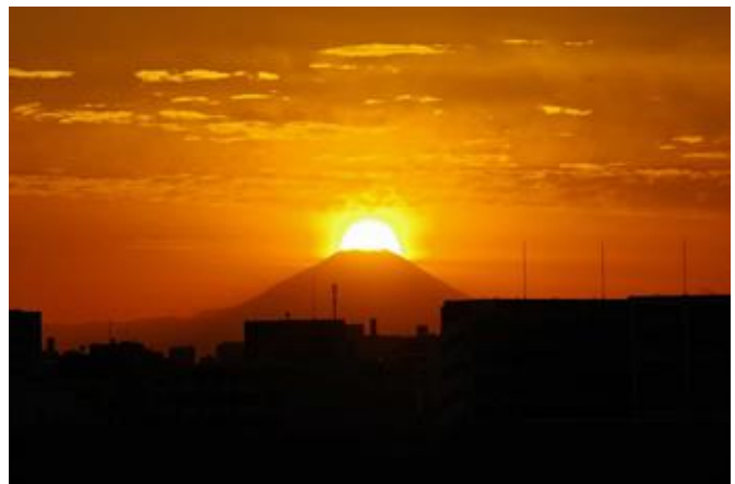
▲天気が良ければ神秘的な景色を見ることができます！（都市農業公園からの写真）

都市農業公園では年に2回、日没前にこの現象が見られ、天気が良く澄み渡った日には、太陽が美しく富士山に沈んでいく様子を見ることができます。ぜひ、取材・報道をお願いします。