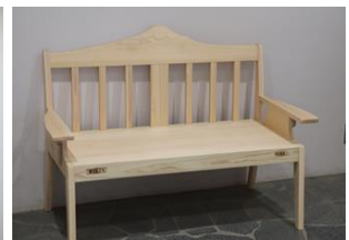
▲寄贈された富士山ベンチ

※雨天時は屋外に設置はしません。また、普段設置しているレストハウス2階にダイヤモンド富士のタペストリーの掲示がありますので、雨の日はタペストリーで雰囲気を感じてみては！