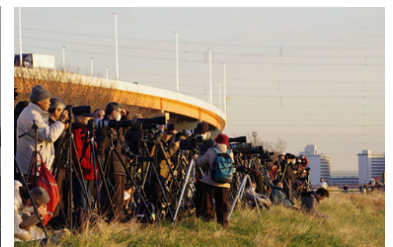
▲多くの方が訪れます（2019年）