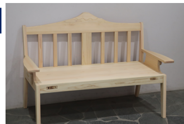
▲寄贈された富士山ベンチ